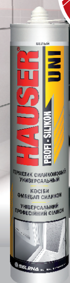
HAUSER UNI ГЕРМЕТИК СИЛИКОНОВЫЙ УНИВЕРСАЛЬНЫЙ