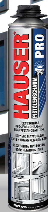
HAUSER ВСЕСЕЗОННАЯ ПРОФЕССИОНАЛЬНАЯ ПОЛИУРЕТАНОВАЯ ПЕНА PRO