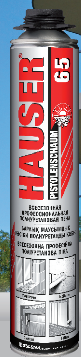
HAUSER ВСЕСЕЗОННАЯ ПРОФЕССИОНАЛЬНАЯ ПОЛИУРЕТАНОВАЯ ПЕНА 65