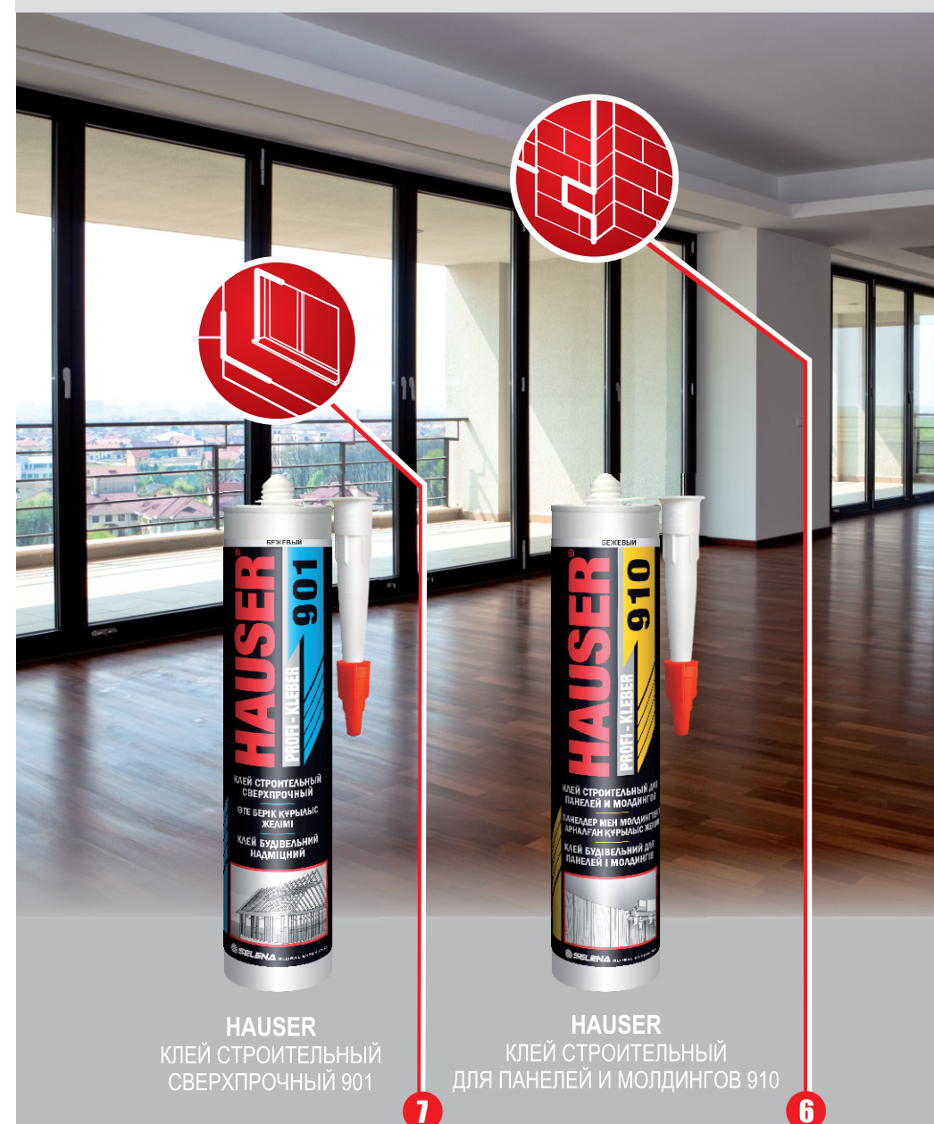
HAUSER КЛЕЙ СТРОИТЕЛЬНЫЙ СВЕРХПРОЧНЫЙ 901