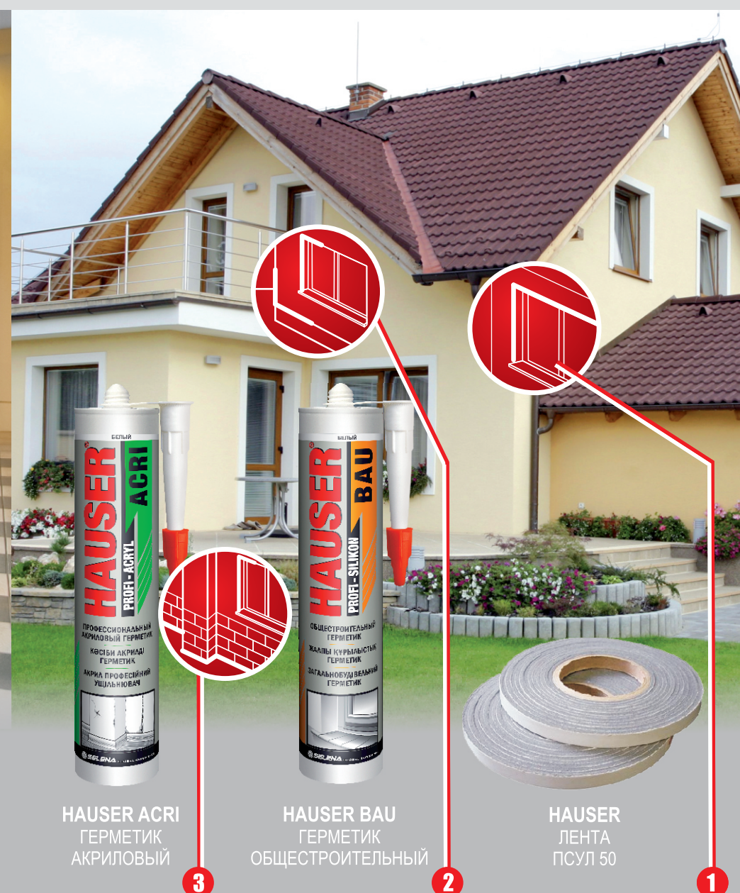
HAUSER ACRI ГЕРМЕТИК АКРИЛОВЫЙ