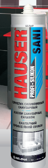
HAUSER SANI ГЕРМЕТИК СИЛИКОНОВЫЙ САНИТАРНЫЙ