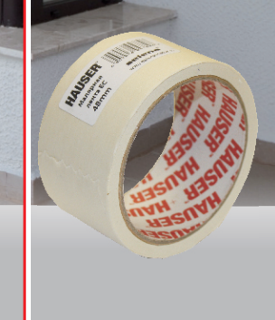
HAUSER ЛЕНТА МАЛЯРНАЯ