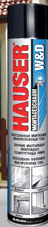
HAUSER ВСЕСЕЗОННАЯ МОНТАЖНАЯ ПОЛИУРЕТАНОВАЯ ПЕНА W&D