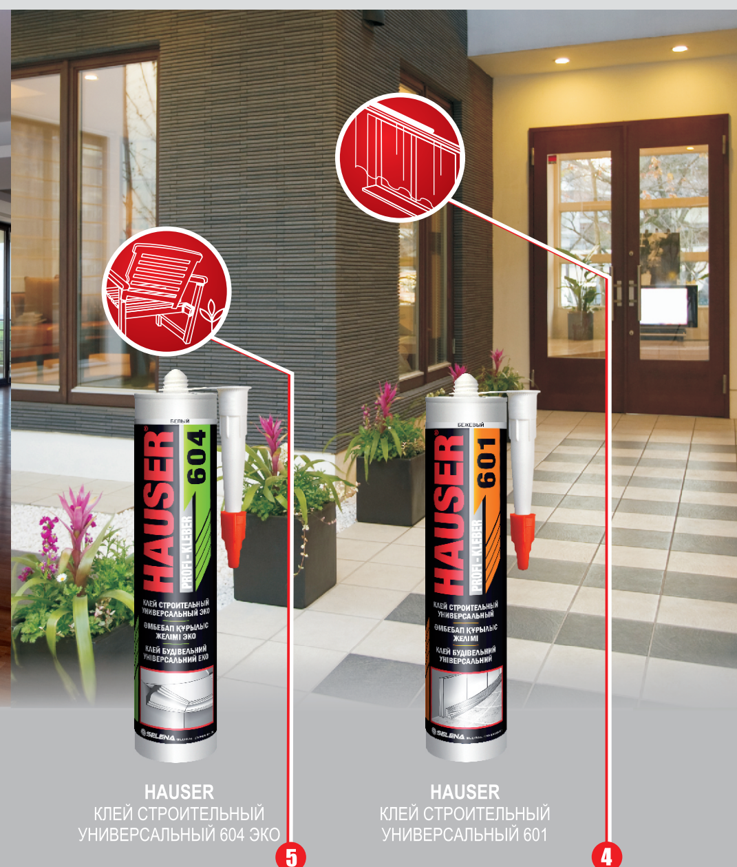
HAUSER КЛЕЙ СТРОИТЕЛЬНЫЙ УНИВЕРСАЛЬНЫЙ 604 ЭКО