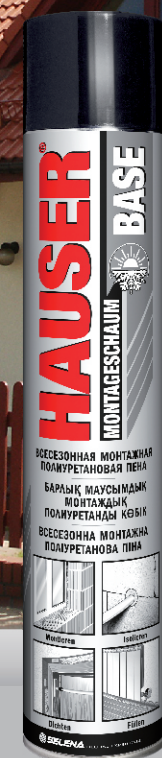
HAUSER ВСЕСЕЗОННАЯ МОНТАЖНАЯ ПОЛИУРЕТАНОВАЯ ПЕНА BASE