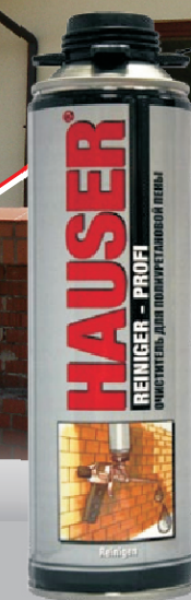
HAUSER ОЧИСТИТЕЛЬ ДЛЯ ПОЛИУРЕТАНОВОЙ ПЕНЫ