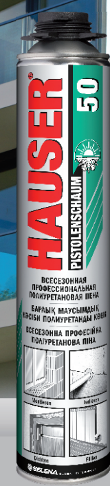
HAUSER ВСЕСЕЗОННАЯ ПРОФЕССИОНАЛЬНАЯ ПОЛИУРЕТАНОВАЯ ПЕНА 50